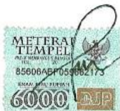
Djarot Kusumayakti Direktur

Demikian pernyataan ini dibuat dengan sebenarnya.